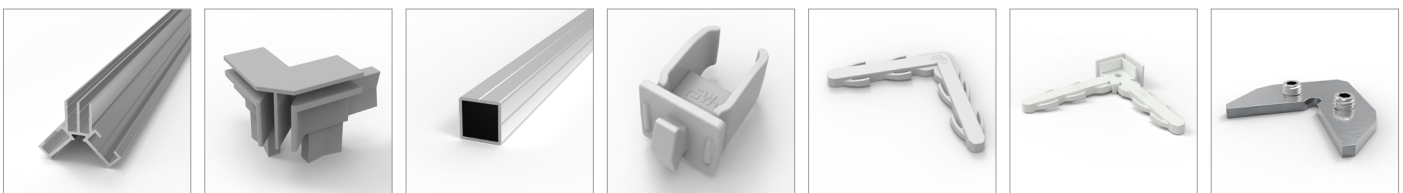
RAPit EDGE 16 31.1916.31